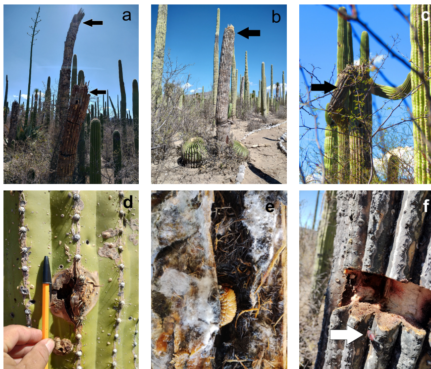
Figura 2. Aspecto de los cactus Neobuxbaumia mezcalaensis afectados por los picudos. (a-c). Plantas trozadas como consecuencia del daño ocasionado por los picudos. (d-f). Orificio de entrada, larva y adulto hallado. / Figure 2. Appearance of Neobuxbaumia mezcalaensis cacti affected by weevils. (a-c). Plants cut as result of being damage by weevils. (d-f). Entry hole, larva and adult found.

Material estudiado. Durante los años 2019 a 2023, se registraron daños inusuales en cactus de la reserva. Las plantas afectadas de N. mezcalaensis de la localidad de San Juan Raya (18°19'14,18"N, 97°37'20,74"O) ubicada al sur del estado de Puebla presentaron galerías internas que asemejaban la entrada de insectos, subsecuentemente comenzaron a secarse y en casos extremos se doblaron y cayeron (Fig. 1). Con el fin de detectar la causa del problema se realizaron prospecciones en los meses de enero y febrero de 2024. En los recorridos se contabilizaron 48 plantas afectadas en un área de 2.000 m 2 . Durante el primer bimestre de 2024 se capturaron 30 picudos para su identificación morfológica. Se analizaron cactus de diferentes edades y con portes de 1,5-5,0 m aproximadamente. Los individuos más dañados presentaron larvas en su interior (Fig. 2). Estas fueron colocadas en frascos con trozos de material vegetal para transportarlas al laboratorio de Biología Agrícola de la Universidad Tecnológica de Tehuacán.